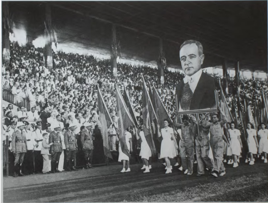
Monteiro, A. "Dia do Trabalho no campo do Vasco da Gama."